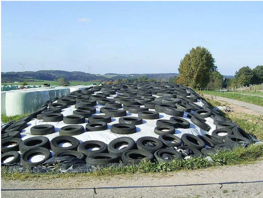
Obr. 3 Kukuřičná oblast vyniká především pěstováním kukuřice na zrno. V řepařské oblasti je však kukuřice pěstována a zpracována specifickým způsobem viz obr. Urči název této metody a další použití.