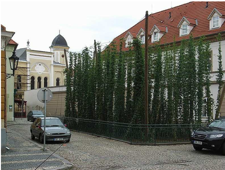
Obr. 4 Tato nejmenší chmelnice se nachází ve městě, které je pěstováním chmele proslavené především odrůdou červeňák, která je vyvážena do mnoha zemí světa. Jak se tato oblast a město nazývají?