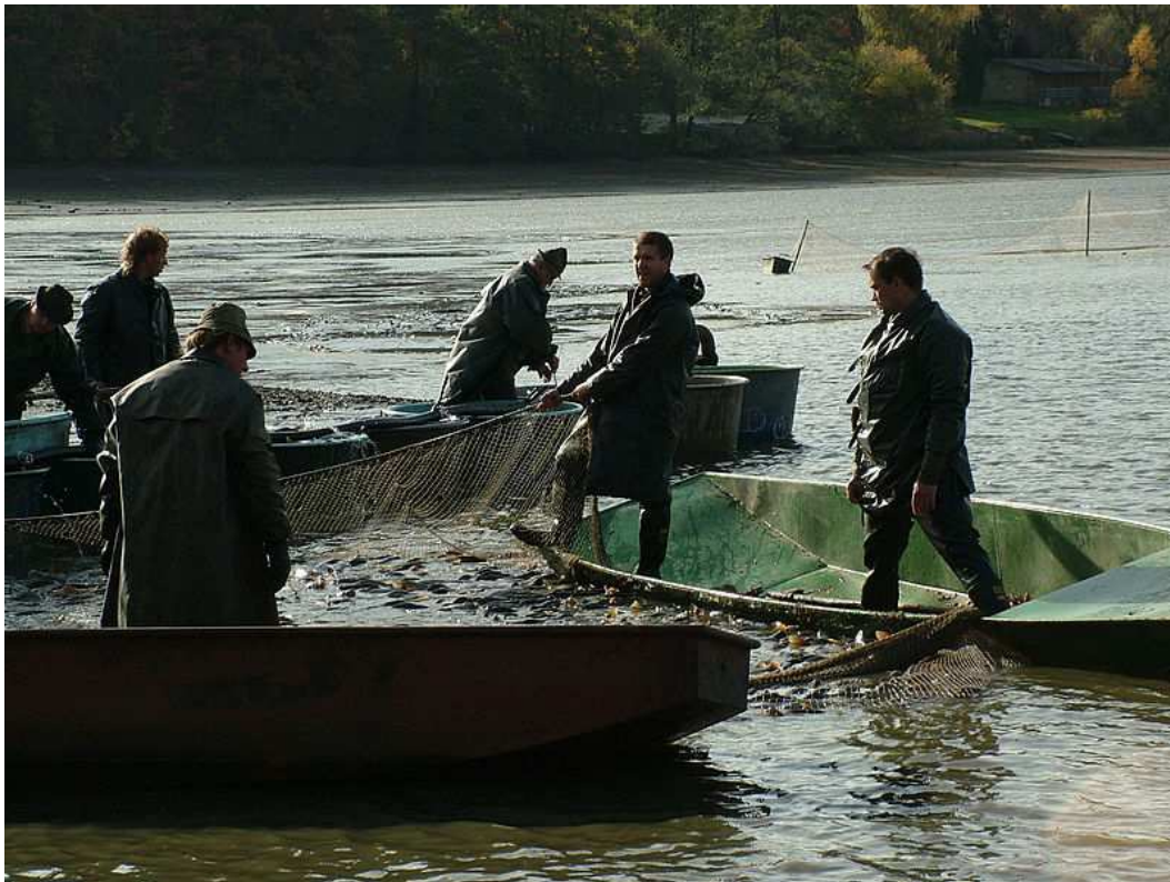
Obr. 2 Do živočišné výroby lze zařadit také rybolov. Lokalizuj rybníkářské oblasti v ČR. Ve které oblasti je chován Pohořelický kapr, který je registrován EU jako specifický druh.