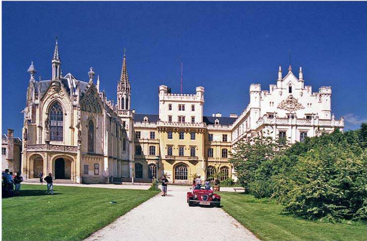
Obr. 4 Urči polohu a název památky na obrázku a zhodnoť její význam pro cestovní ruch v JMK. Kdo dnes památku spravuje a kdo ji vlastnil dříve?