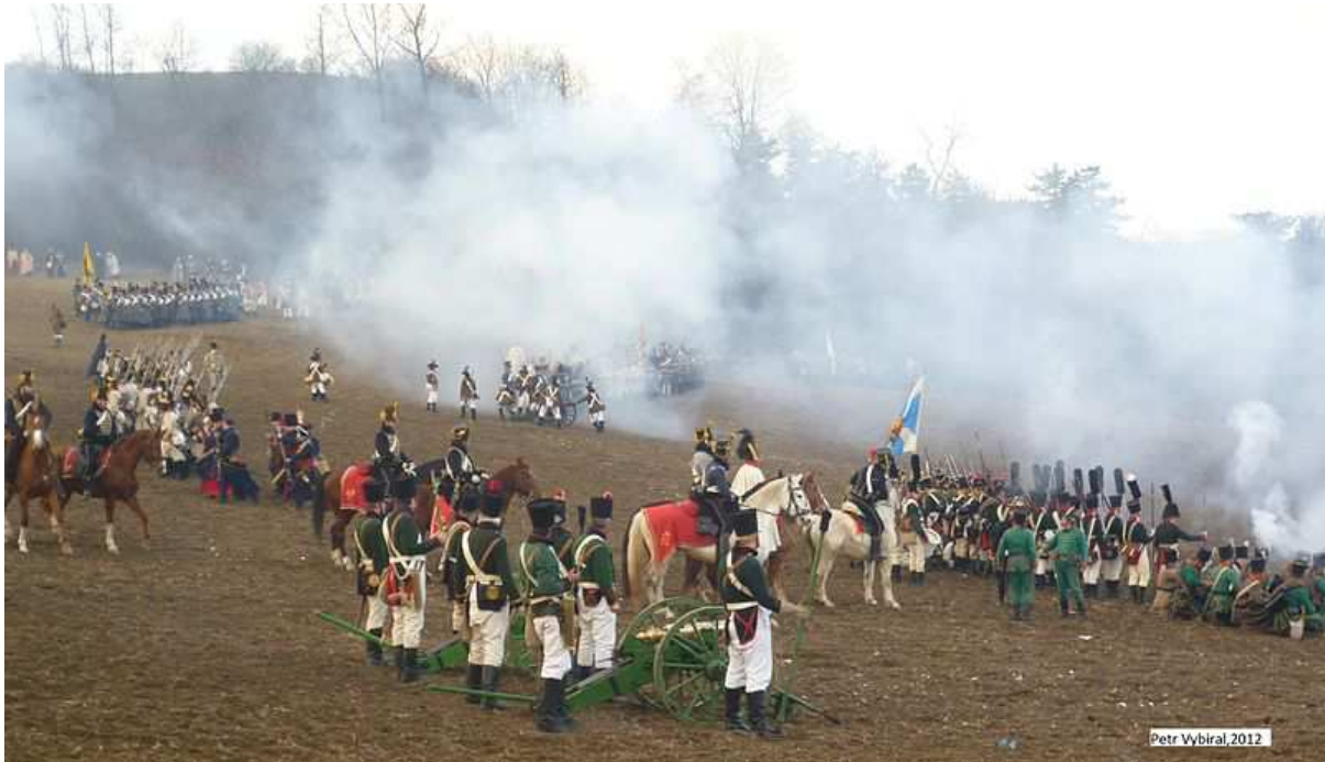
Obr. 2 Na obrázku je vidět rekonstrukce jedné světoznámé bitvy. Vojska, kterých panovníků se zde střetla. Kdy jsme oslavili dvoustleté výročí konání této bitvy?