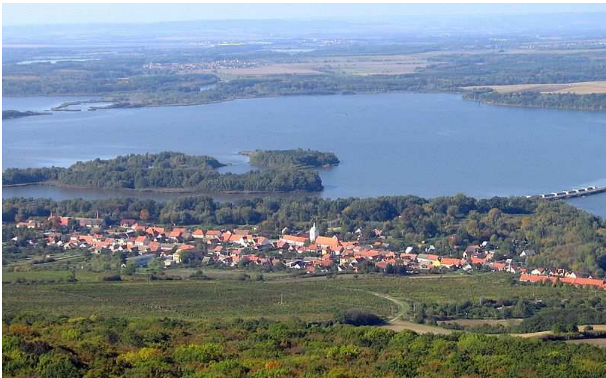
Obr. 3 Na obrázku je vesnice, v jejíž lokalitě byla nalezena během archeologických průzkumů Věstonická Venuše. Urči její název stejně jako název vodní plochy, rovinaté krajiny a pohoří na horizontu.