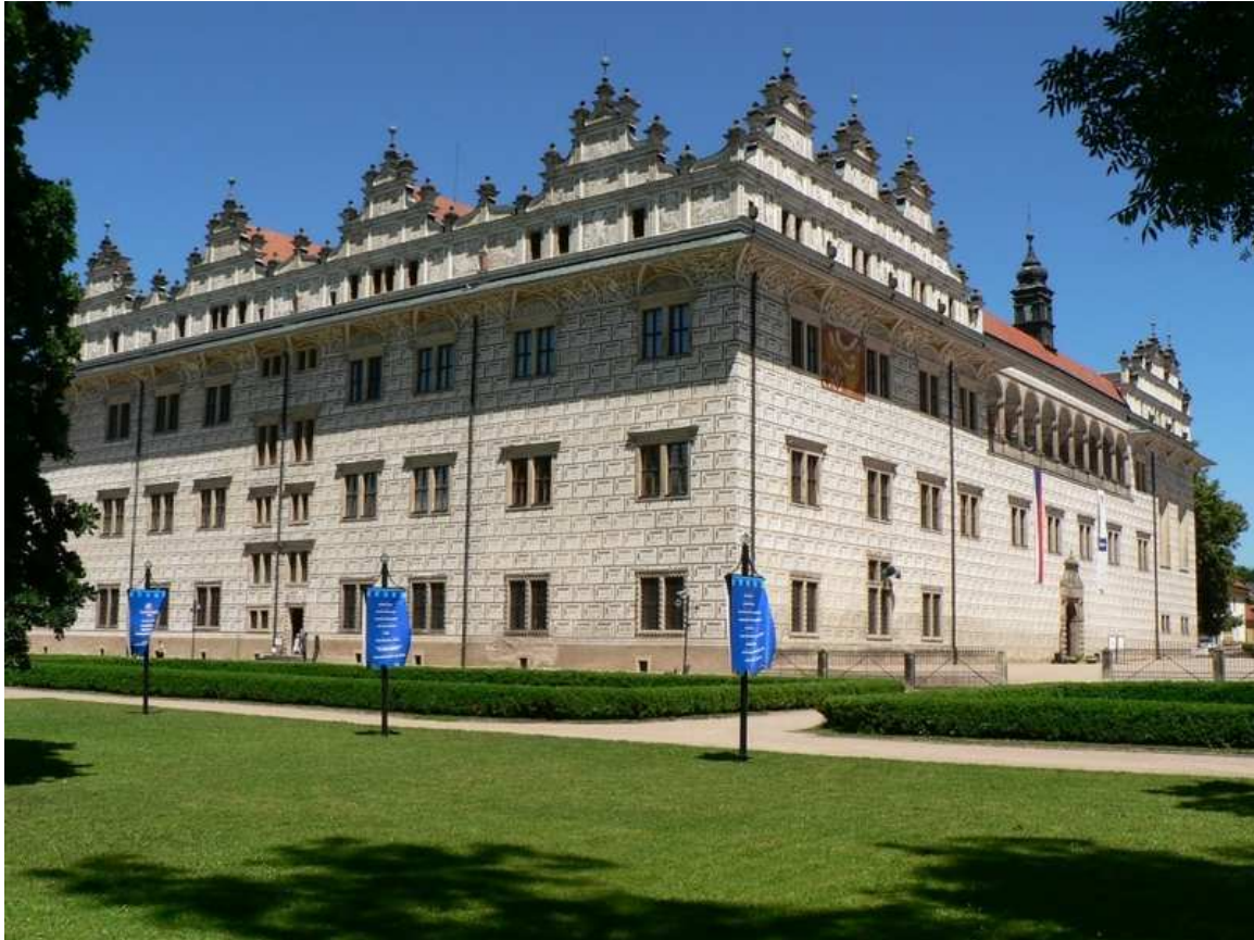
Obr. 3 Pardubický kraj patří k regionům ČR, které mají na svém území také památku UNESCO. Urči, o jakou stavbu se jedná a které sídlo zdobí?