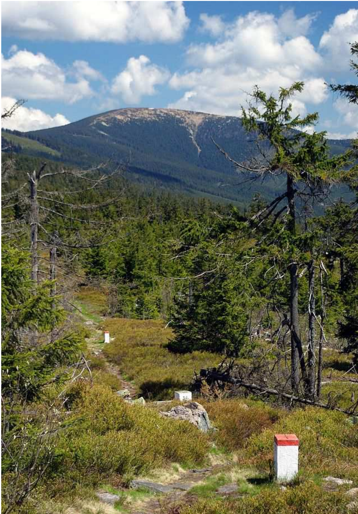
Obr. 2 Králický Sněžník je nejvyšším vrcholem stejnojmenného pohoří. Jaký je jeho hydrologický význam v rámci Evropy?