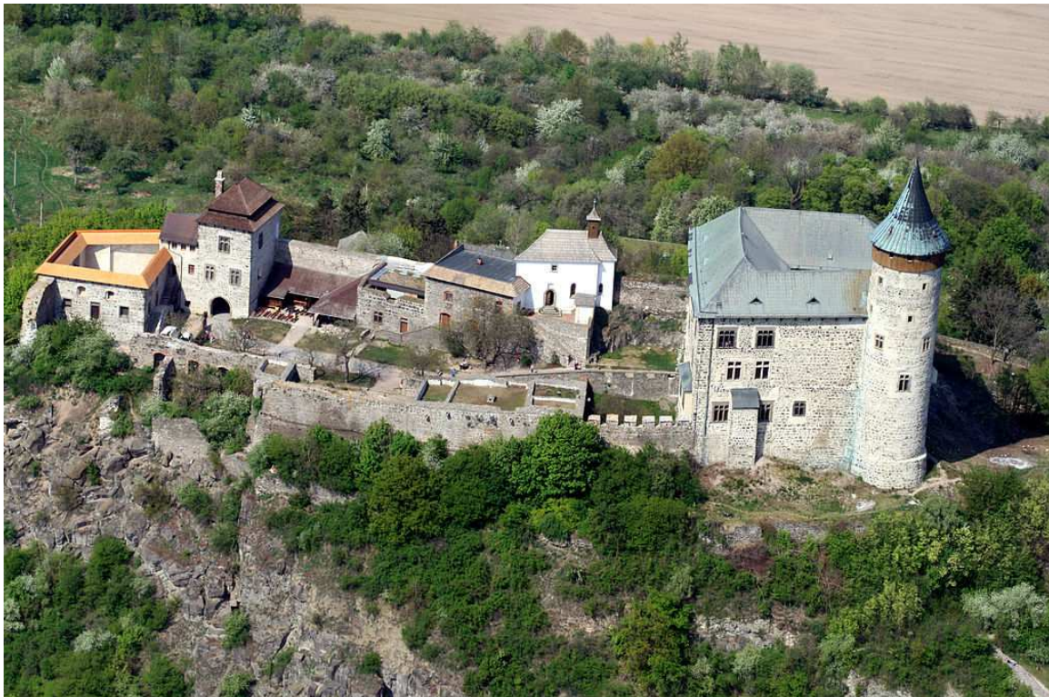
Obr. 4 Obě největší města východních Čech se mohou kochat pohledem na tento hrad. Jak se jmenuje hora, na které stojí?